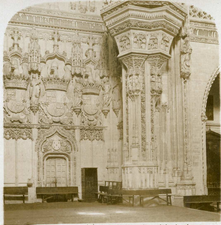
S. 190 - 5206. Tolède. Saint-Jean des Rois. Bas-côtés du chœur.