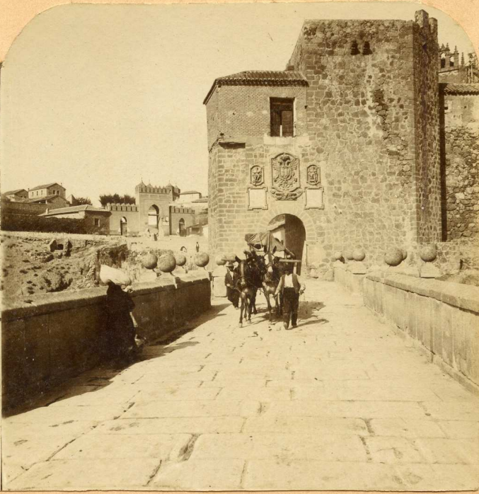
738. TOLEDO PUENTE SAN MARTÍN

ARQUITECTURA. HISTORIA. COSTUMBRES. MARINAS. PAISAJES. CIUDADES. & C.