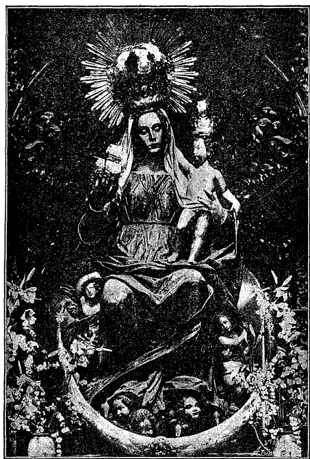
IMAGEN DE NUESTRA SEÑORA DEL BUEN AIRE

INTERNATIONALIS INSTITUTIO «ORA ET LABORA», anno 1905 in Seminario-Universitate Pontificia Hispalensi (Sevilla-España, Apartado postal 84) fundata, et Romanorum Pontificum benedictionibus abunde locupletata, seminariorum alumnos, crastinos sacerdotes, exercet in Paestra veri apostolatus, ut bonum Ceramen certantes, coronam justitiae habeant, simulque sacerdotes ipsos quamaxime juvat ad perfectionem et propriam et suorum apostolicorum operum, triplici in ordine, morali, nempe, technico et oeconomico inquirendam; necnon utitur in luctamine ideatum, sub Episcoporum moderamine, novissimis armis científico progressu acquisitis, et praecipue adjumento Prelii, quod per Cruciatam et annum celebrationem Dia de la Prensa Católica (29 Junii), oratione, propagatione et collecta , in toto orbe terrarum fovet, ad Evangelium Christi in mundum universum facilius et uberius, adjunctis temporum praecoculis habitis, praedicandum, quaerendo primum Regnum Dei, juxta illud S. Pauli Apostoli: Omnia vestra sunt; vos autem Christi; Christus autem Dei. — Dr. J. Montero.