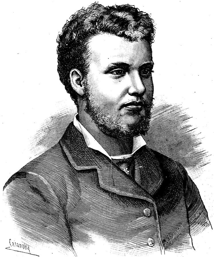
S. A. R. EL SRMO. SR. D. CARLOS FERNANDO DE BRAGANZA Príncipe heredero de Portugal