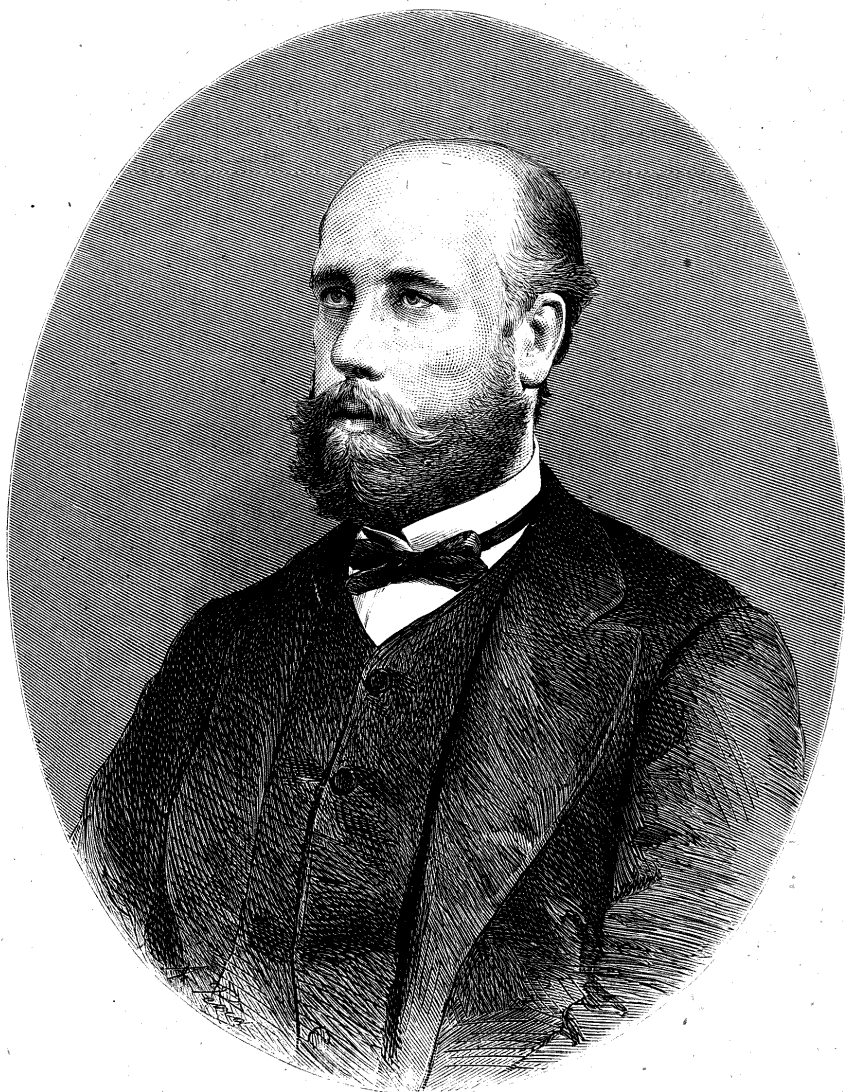
EXCMO. SEÑOR DON EDUARDO GASSET ARTIME.

Hace pocos años el cortesano se resignaba á pasar los ardores del estío