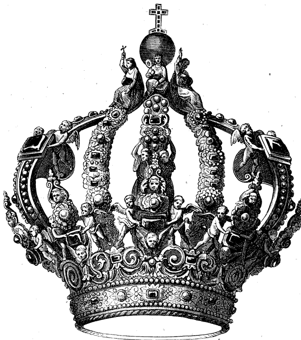
CORONA IMPERIAL DE LA VIRGEN DEL SAGRARIO EN TOLEDO.

Se ha repartido ya el programa de los conciertos que han de verificarse esta primavera en el teatro y Circo