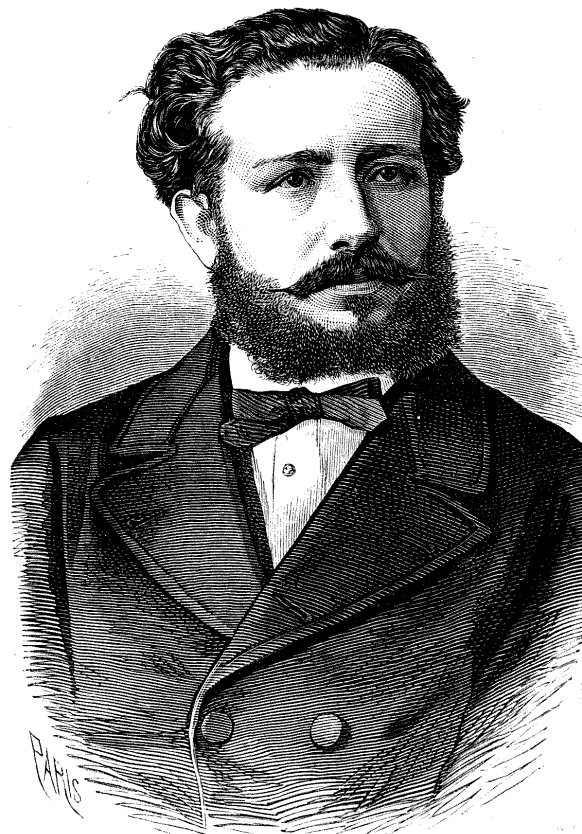
DON FRANCISCO DE PAULA MONTEMAR. MINISTRO DE ESPAÑA EN FLORENCIA.

Su aspecto generalmente les denuncia como seres cuya existencia es un problema no resuelto aún por la estadística: especie de camaleones que se mantienen del aire, al parecer, pues nadie los conoce, finca que les dá renta, papel del Estado, sino es la lista de la lotería, y así que algo en su favor, ni crédito que no hablen y aún grite en contra suya.