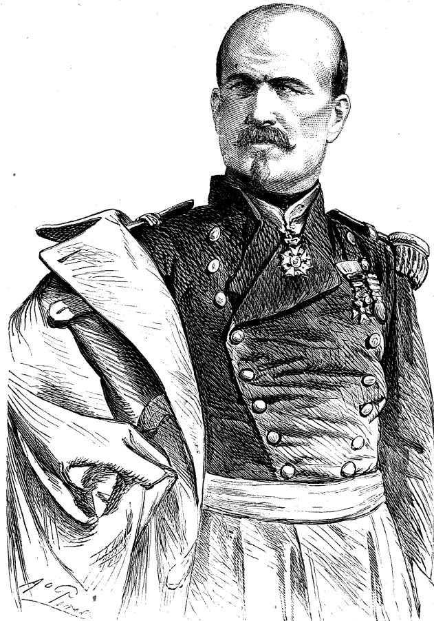
EL GENERAL TROCHU, GOBERNADOR MILITAR DE PARÍS.