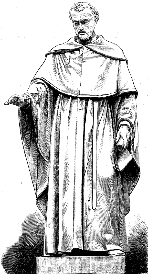
FRAY LUIS DE LEON.

En una exposicion dirigida al señor Ministro de Fomento por el editor y propietario de La Ilustracion Española y Americana , exposicion que se ha repartido impresa al público, se critica duramente el hecho de haberse un centro oficial suscrito á nuestro periódico por determinado número de ejemplares, mientras el suyo no ha logrado obtener la misma gracia. Va-