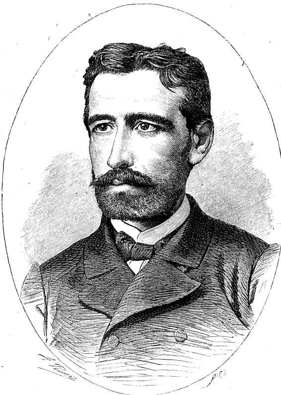
D. EUGENIO MONTERO RIOS.

El soldado suprimiria las horas de ejercicio y las que se pasa yendo y viniendo, helado en invierno, abrasado en verano, á la puerta del cuartel en pesada centinela: el empleado las horas en que hace como que despacha los expedientes: la patrona de huéspedes las en que debiera servir á sus víctimas el pan tradicional del pupilaje, más negro que el de la emigracion y más duro que las cadenas de la servidumbre: el presidiario los momentos, y los días, y los años que han de pasar ántes que recobre su libertad querida: la bella el espacio de tiempo que falta para su boda: el galán los instantes que tarda en poseer á la reina de sus amores. Y toda la humanidad borraría tan