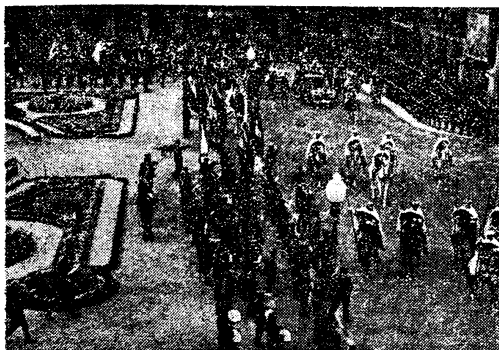
La magnífica Plaza Mayor de Salamanca es el mejor marco para las solemnes ceremonias de presentación de credenciales al Generalísimo.