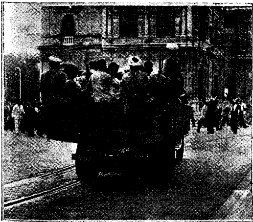
Hoy hace un año. Los primeros moros que desembarcaron en la península cruzan por las calles de Sevilla. El ingenio, la audacia y el valor del general Queipo de Llano hizo pasar a estos moros por su calle. En ese camión se disponen a entrar en la Plaza de San Fernando

SALAMANCA.—Hoy día 18 con motivo del primer aniversario del Glorioso Movimiento S. E. El Generalísimo, hablará por Radio Salamanca a las diez y media de la noche.