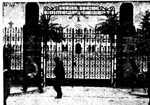
Los del conglomerado comunista separatista no tienen ya ni dónde caerse muertos.

Desde el momento en que la gran masa roja quedó inmobilizada a escasa distancia de su punto de partida, quedaba frustrado su intento, que no era adquirir ciertas posiciones, sino el de romper el cerco para coger de revés al Ejército que guarnecía el frente Sur de Madrid. Esa ruptura y envolvimiento es la pesadilla del Estado Mayor de Miaja, y ese es también el ideal perseguido a través de los numerosísimos ataques.