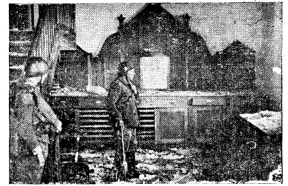
Altar mayor de la iglesia de San Miguel, de Benagotia, profanada por los rojos