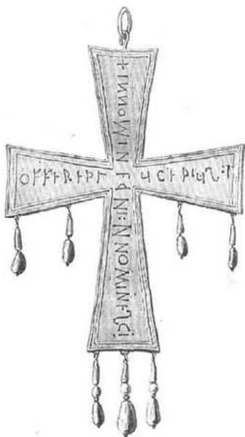
NÚM. 3. CRUZ OFRECIDA POR LUCETIUS.