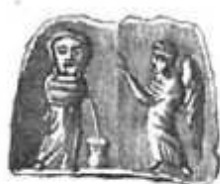
NÚM. 6. IMPRONTA EN LACRE DE LA ANTERIOR PIEDRA.