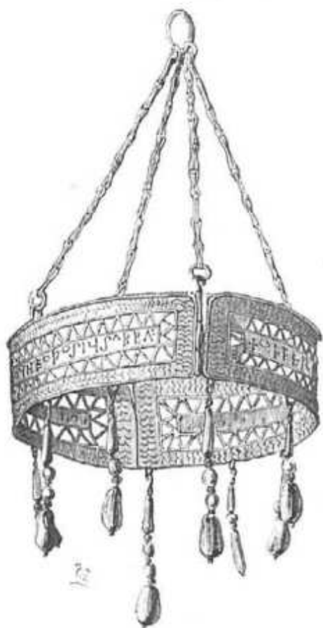
NÚM. 2. CORONA VOTIVA DEL ABAD TEODOSIO.