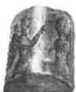
NÚM. 5. PIEDRA GRABADA.