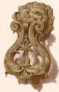
Escala de 0,40 por metro.