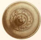
Mitad del natural.