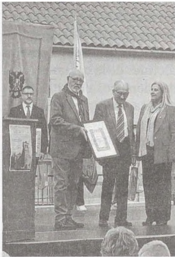
Monteños distinguidos 2023

Existe una vacante en la Junta Directiva que se necesita cubrir y que será anunciada en la orden del día de la próxima Asamblea General. Necesitamos voluntarios.