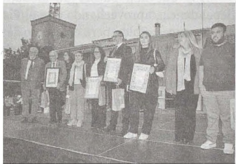
La Llega reunió a una veintena de alcaldes de la zona.