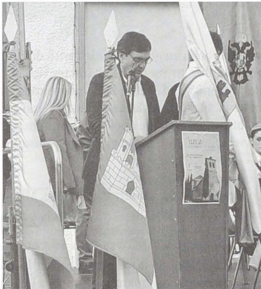
Pregonero de la Fiesta Monteña.