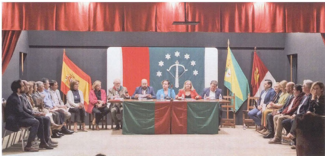
Reunión general de la Llega 2023.