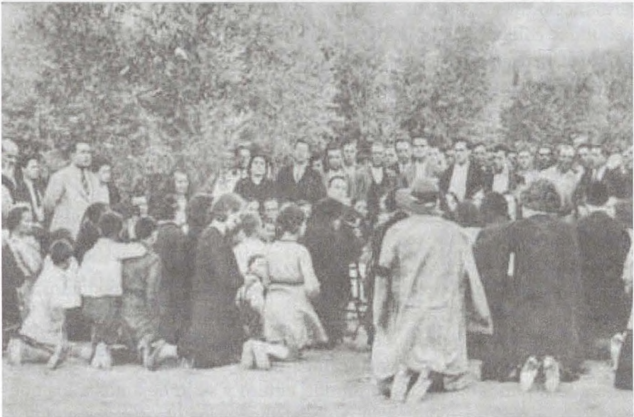
Supuestas apariciones de la Virgen en Guadamur, "El Castellano" 1931.

En los hechos recogidos en este artículo no existe ni mito, ni leyenda, son unos sucesos más o menos curiosos y algunos dignos de estudiar por especialistas. Sin embargo los encantamientos, apariciones de seres que se esfuman entre los riscos de la montaña, ciertos lugares mágicos, y otras creencias muy extendidas en la comarca tiempo atrás, forman parte de los mitos monteños que sería deseable recuperar antes que la memoria, convertida el archivo personal o colectivo, sea abatida por el tiempo.