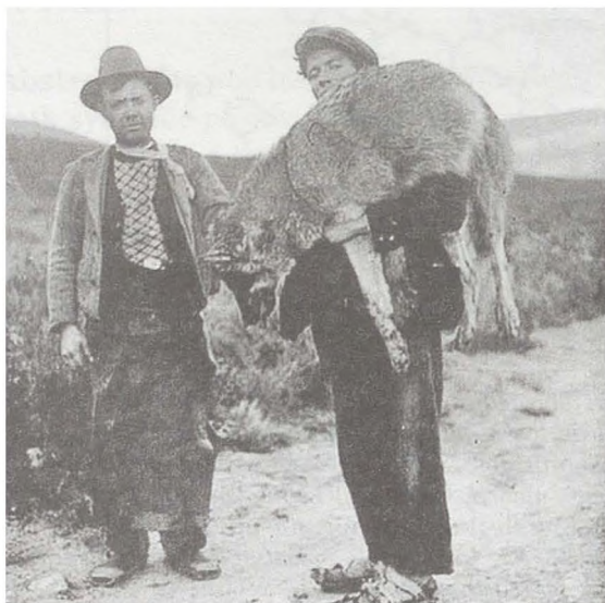
Foto 2. Un lobo abatido a comienzos de siglo XX en la zona sur de los Montes de Toledo, probablemente cerca de Cabañeros.

La actitud de rechazo motivada por el miedo hacia el lobo, es la responsable de su disminución y casi extinción. En el caso de los Montes de Toledo, contamos con anécdotas de época del Conde de Romanones, D. Álvaro Figueroa y Torres, ya en el primer tercio del siglo XX, con su administración de la finca El Robledo de Montalbán (desde las Navillas hacia Menasalbas), donde se propició la caza de estos animales salvajes como lince, lobos y aves de rapiña, en esa época consideradas como alimañas por alimentarse de la caza de esos cotos. Siendo las piezas abatidas exhibidas en fotografías para después ser quemadas una vez que el Conde abonaba a los lugareños determinada cantidad por pieza abatida. Sin duda prácticas de otra época y otras motivaciones como la de preservar la caza, eran el motor de estas iniciativas.