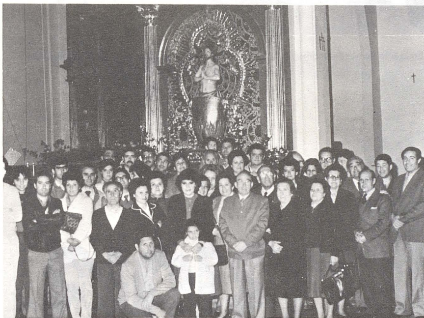
Vemos una foto de recuerdo en la que se entremezclan juventud y experiencia