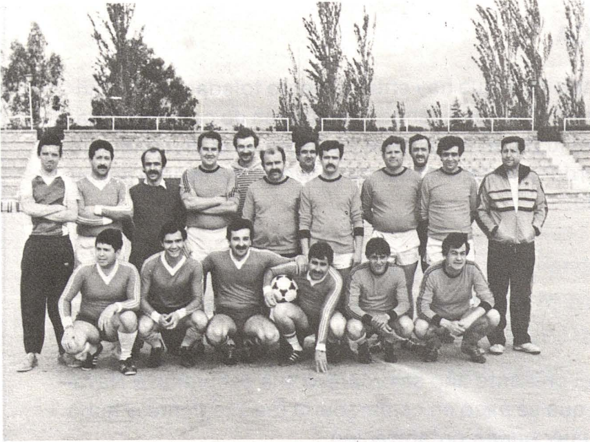
Conjunto de los dos equipos de fútbol