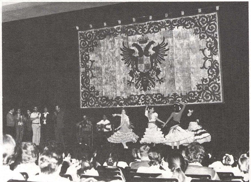
Momento de la actuación de la Peña Flamenca «El Quejío»

El día 4 de mayo, y con motivo del día dedicado a la familia, la Peña Flamenca «El Quejío» actuó formidablemente ante una gran cantidad de socios que con sus familiares abarrotaban casi al completo el Salón de Actos de la Caja de Ahorro de Toledo, que tan gentilmente nos cedió para este fin.