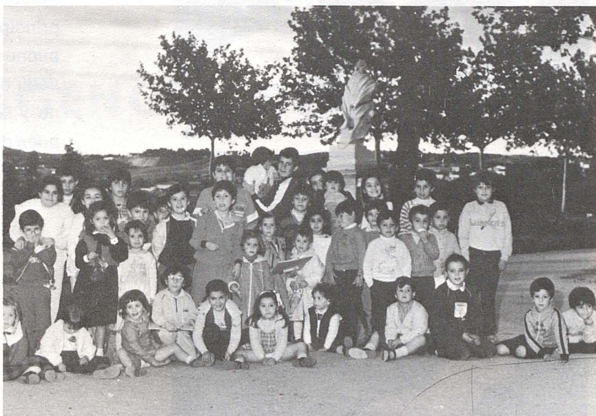
He aquí los futuros «Picassos» de nuestra época

En la cafetería El Cambrón, paseo de Recaredo, tuvo lugar el acto más entrañable de todos cuando pudimos o supimos organizar. Este concurso de dibujo fue una joya de incalculable valor. La alegría con la que los niños se sentaron a dibujar y el ánimo que en ellos se intuía, vino a demostrar que actos de esta índole no deben dejarse en olvido, ya que a los niños les encanta que se les tenga en cuenta. Al final del concurso se hizo entrega de los premios a los ganadores, consistente en libros, así como unos pastelitos que a todos los niños asistentes se les brindó por gentileza de la Casa Bimbo, a la cual también agradecemos.