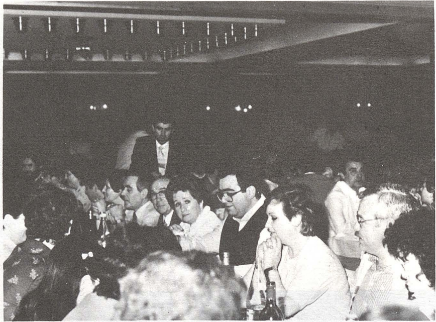
En la foto vemos un momento de meditación antes de «desnudar» a los langostinos