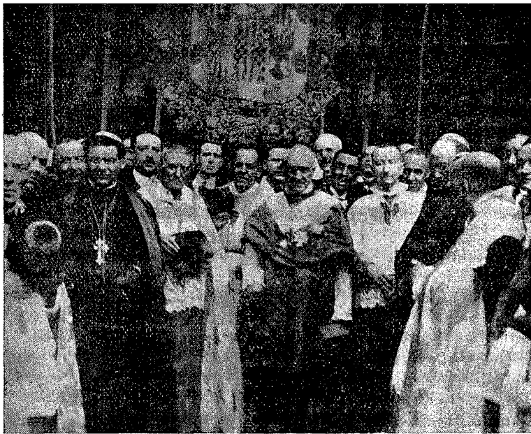
El nuevo Primado al pasar a la Catedral.

Como anunciábamos en el número pasado, el domingo llegó a ésta el nuevo Prelado, muy ilustre Cardenal Dr. Reig Casanova.