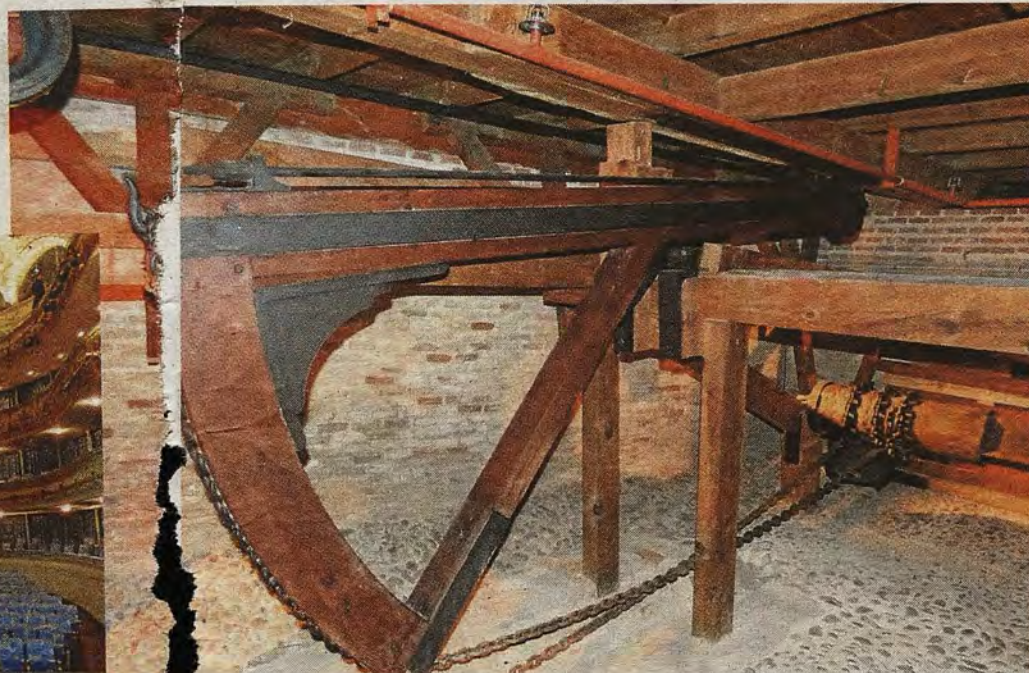
Detalle de la maquinaria para elevar el patio de butacas. Abajo, arco de embocadura del escenario. A la derecha, telón de embocadura.

Concluidas pues las obras, la vida de esta caja mágica comenzaría a cumplir debidamente su cometido desde el sábado 18 de octubre de 1878 hasta la actualidad.