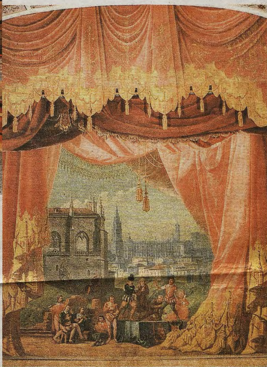
TEATRO DE ROJAS

La vida de esta caja mágica comenzaría a cumplir debidamente su cometido desde el sábado 18 de octubre de 1878 hasta la actualidad