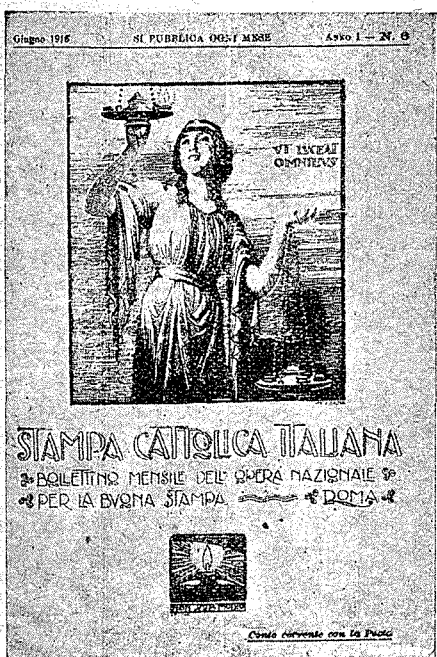
STAMPA CATTOLICA ITALIANA

creadas para el fomento de la Buena Prensa y que se reciben en nuestro Centro.