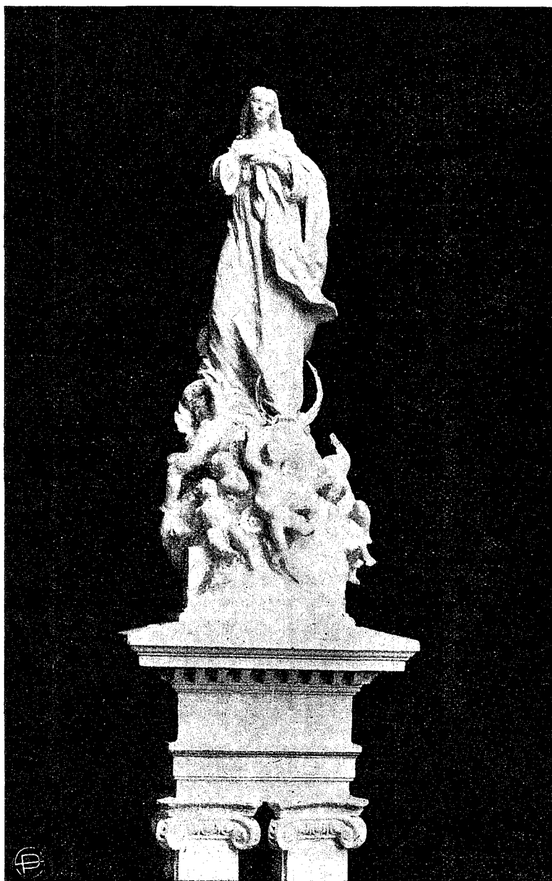
Parte superior del Monumento a la Inmaculada, próximo a inaugurarse en Sevilla, para cuya realización se hizo una suscripción que ascendió a más de 100.000 pesetas.