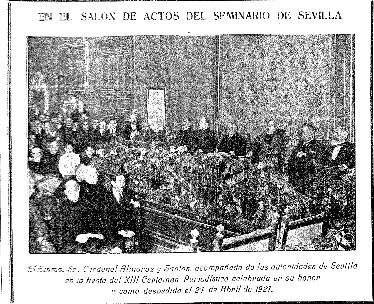
EN EL SALON DE ACTOS DEL SEMINARIO DE SEVILLA El Emmo. Sr. Cardenal Almaraz y Santos, acompañado de las autoridades de Sevilla en la fiesta del XIII Centenario Periodístico celebrada en su honor y como despedida el 24 de Abril de 1921.

¡Vaya si vendría! Y, efectivamente, casi a vuelta de co-