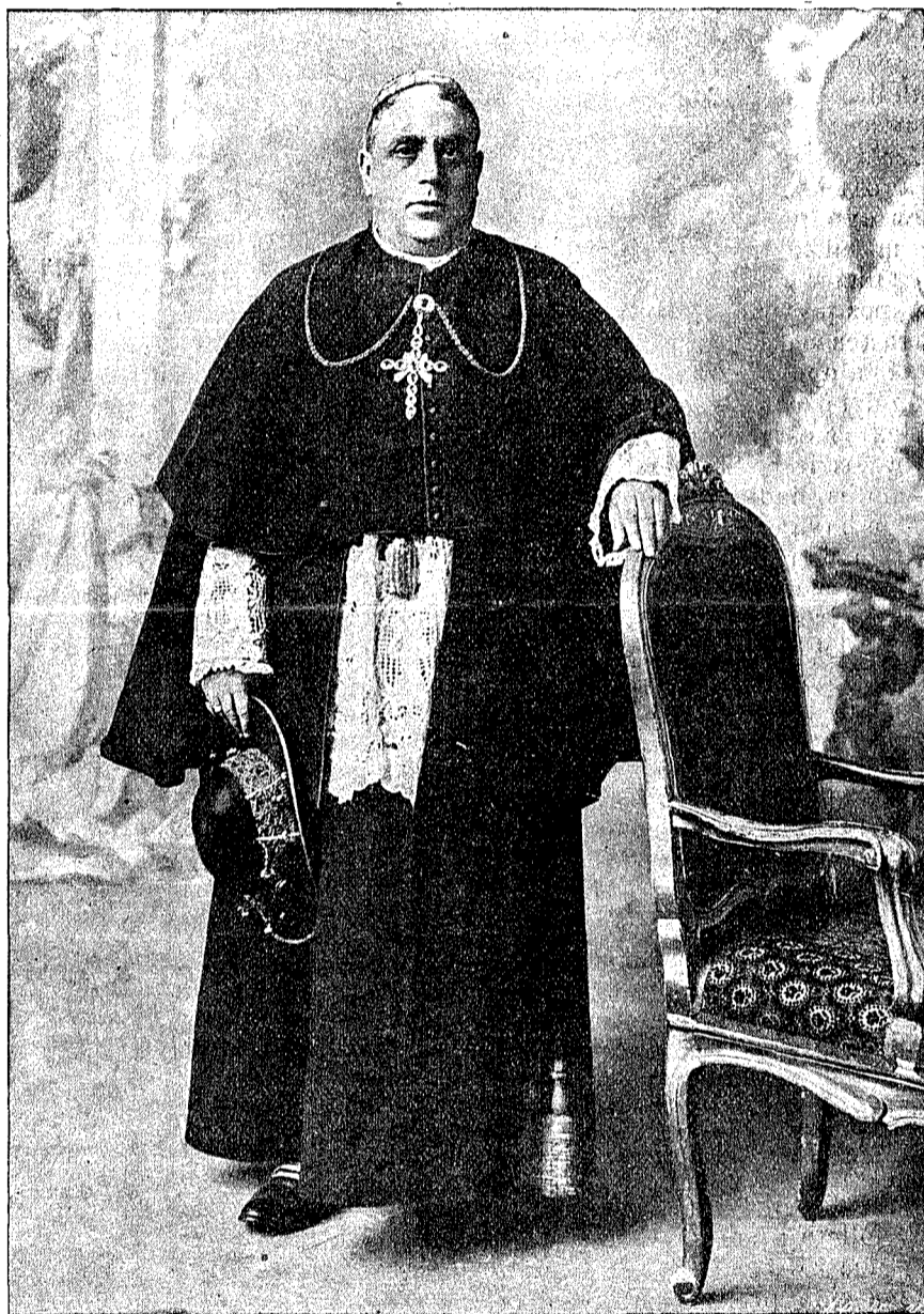
Emmo. y Rvdmo. Sr. Dr. D. Enrique Almaraz y Santos Cardenal Arzobispo de Toledo