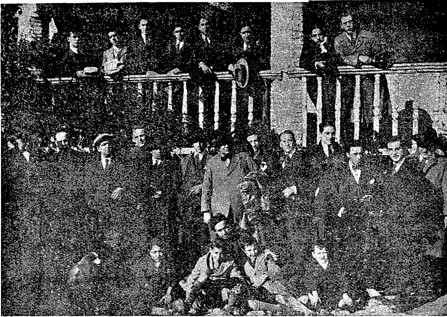
Grupo de excursionistas en la Casa del Greco.