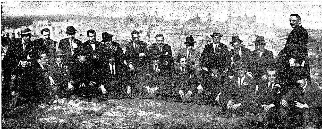
El Gobernador con los periodistas después del almuerzo.