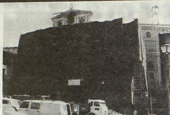
Remodelación del Teatro Rojas