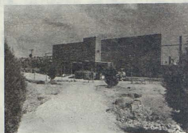
Obras de construcción del Polideportivo de Santa Bárbara