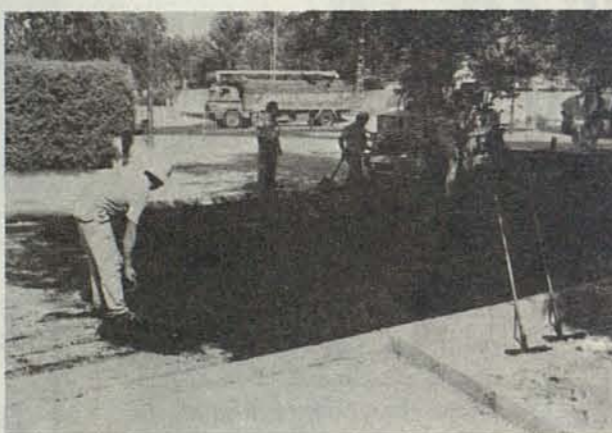
El Ayuntamiento también crea empleo