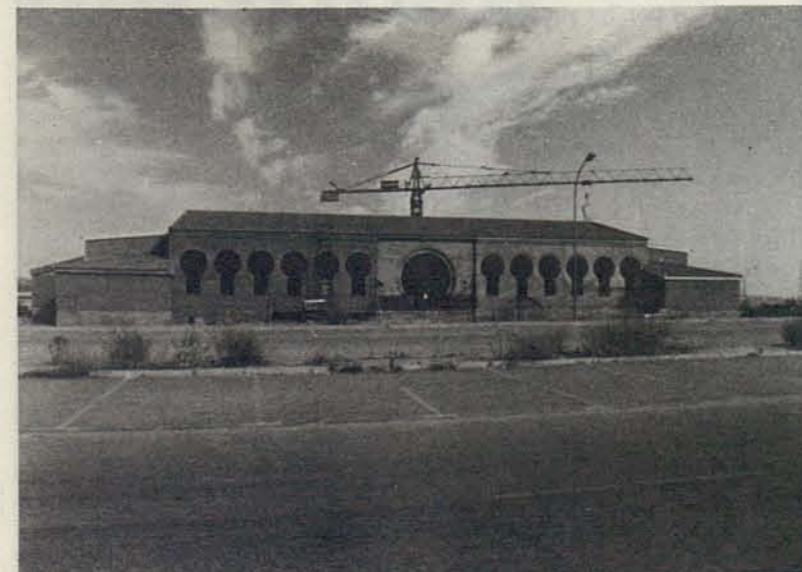
Obras del Polideportivo del Polígono