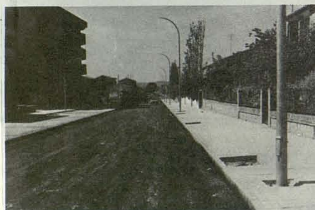
Urbanización de la calle Coronel Baeza

El Ayuntamiento de Toledo prosigue en su tarea de ir completando la infraestructura básica de las distintas zonas de la ciudad, al tiempo que continúa la labor de mejora de las redes de saneamiento y pavimentación. En la actualidad se están llevando a cabo numerosas obras, tanto de saneamiento, pavimentación, alumbrado, como de equipamientos deportivos y culturales de nueva creación. Por otra parte, cabe destacar que hay bastantes obras subvencionadas por el Acuerdo Económico y Social (AES) que suponen un ahorro considerable a las arcas del Ayuntamiento. A esta importante acción inversora del Ayuntamiento, que en palabras del Alcalde «contribuye de forma decisiva a mejorar la ciudad y crean empleo», hay que unir las actuaciones tanto de la Junta de Comunidades de Castilla-La Mancha como de la propia Administración Central. Además del importante número de obras ya en marcha, de las que ofrecemos al margen un resumen, están pendientes de contratación para los próximos meses obras como el Centro Cívico de Palomarejos, el Centro Cultural de Azucaica, etc. «De esta forma, con su política de inversiones, el Ayuntamiento contribuye también a crear empleo», según nos afirma el Alcalde.