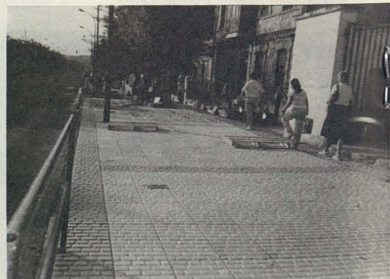
Urbanización de la margen derecha de la Avda. de Barber