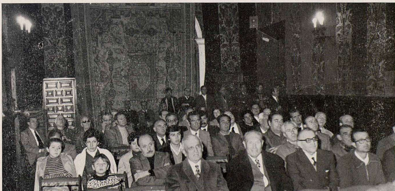
Los funcionarios reunidos en el acto de Final de 1976

“Y nada más: que la Virgen del Sagrario siga protegiendo a nuestra Ciudad, que interceda para conseguir se conviertan en realidad aquellas aspiraciones que más convingan a los toledanos y por su mediación se nos proporcione a todos un feliz y próspero año 1977”.