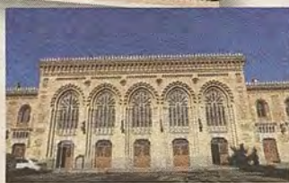
Acceso al vestíbulo general. ( R. del Cerro)