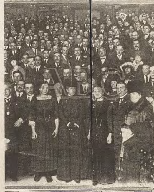
Congreso de Medicina: inauguración en Madrid, M. Curie y congresistas visitando Toledo

DIARIO ILUSTRADO. DO. ANO DECIM QUINTO. N. 3.0 10 10 10 5 CENT