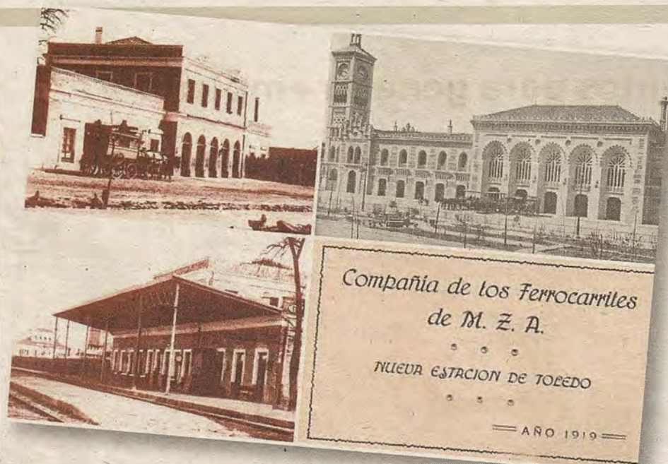
Arriba, la antigua terminal de 1858 y el nuevo edificio en abril de 1919. A la derecha, el aagrama de la empresa MZA (Madrid-Zaragoza-Alicante)