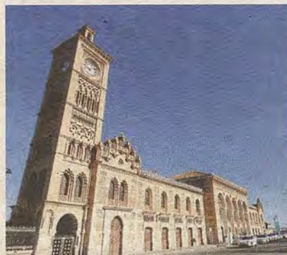
Fachada principal de la Estación en 2015. ( R. del Cerro)

RID. DIA 25 DE 11 DE 1919. ERO SUELTO NTS. 10 10 10