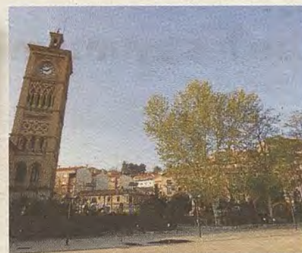
Espacio que ocupó la primitiva estación entre 1858 y 1919. (R.del Cerro)