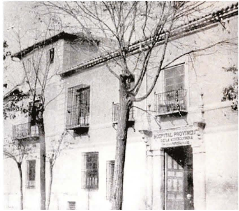
El Hospital Provincial en su antigua ubicación, en la plaza de Padilla, donde permaneció hasta finales de 1932. Siempre fue el principal centro de referencia médico-quirúrgica, de carácter público, en Toledo