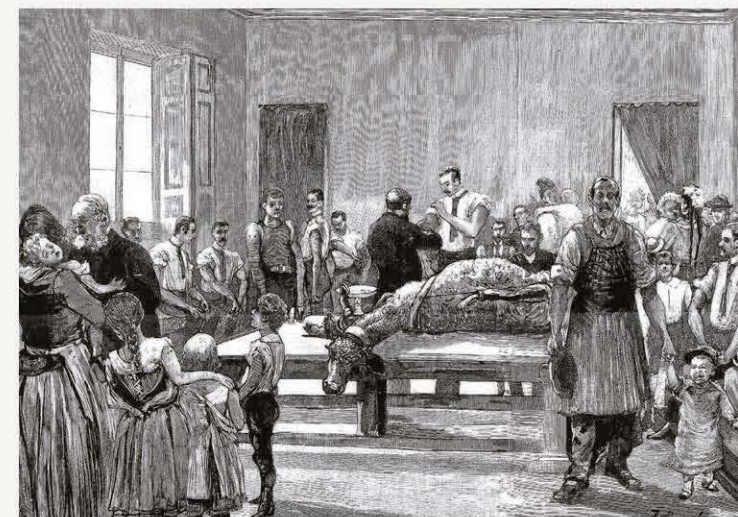
Vacunación directa de una ternera en el «instituto del estado», como preservativo contra la epidemia variolosa. Dibujo del natural de Comba publicado en octubre de 1890 en La Ilustración Española y Americana

tativos, personal, obras, etc. Las carencias reales para atajar todos los frentes se manifestaban con el paso de las semanas. El 15 de octubre, Saturnino Milego, director de El Nuevo Ateneo , pedía a otros colegas la publicación de las medidas dispuestas por el municipio para atender la epidemia que ahora decaía. Lo hacía tras una cercana vivencia que revelaba la no desinfección de efectos, la supresión de los auxilios médicos y la falta de inmedia-