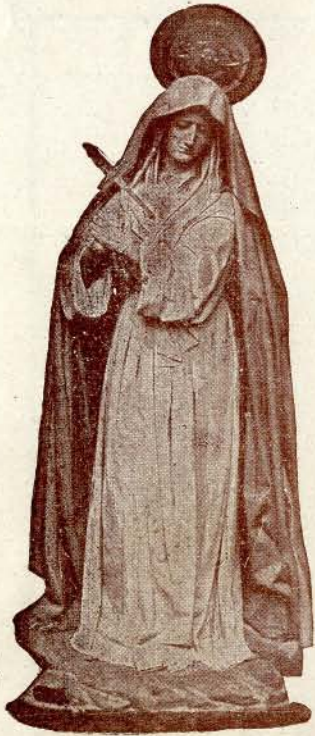
María Santísima de los Dolores

A las veintiuna, procesión de Jesús Nazareno: Saldrá de la Iglesia de Santo Tomé, figurando en ella los «pasos» «Aterrado a la columna», «Jesús Nazareno», «Cristo de la Vega», «Ecce-Homo» y «María Santísima de los Dolores».