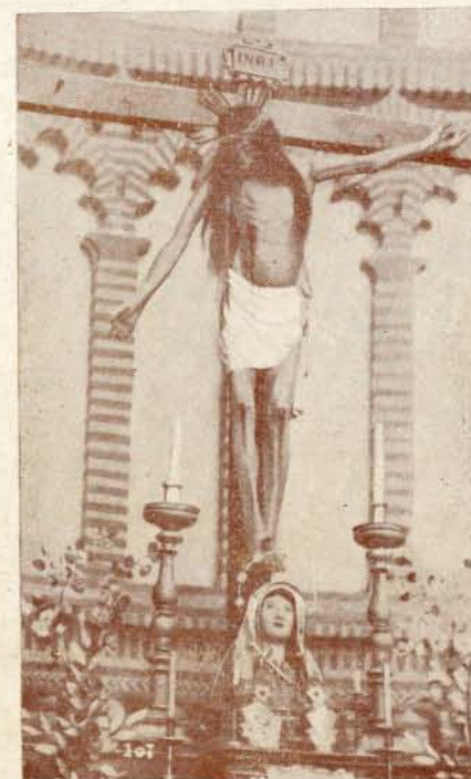
Santísimo Cristo de la Vega