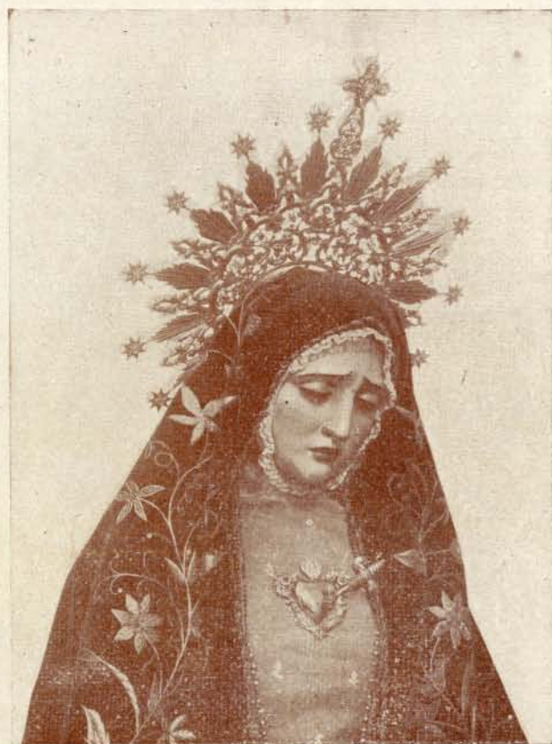
Nuestra Señora de la Soledad