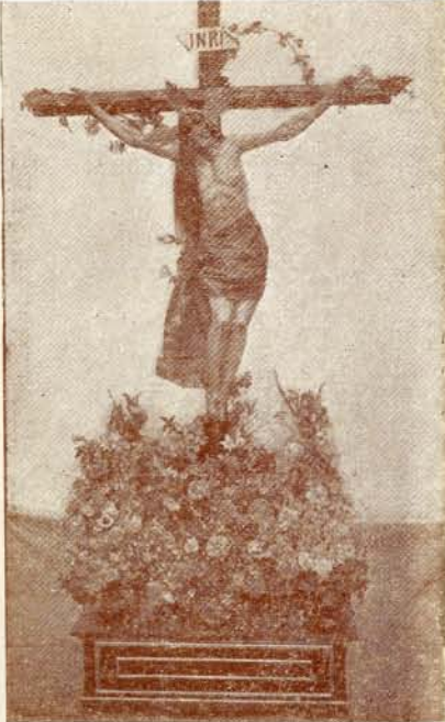
Stmo. Cristo del Calvario