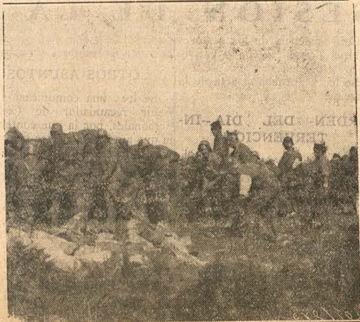
El enemigo se ha puesto a tiro