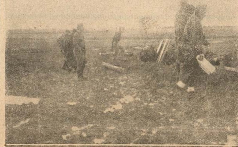
El agua volvió a traer la calma al frente

Y a nosotros, que mantenemos una honradez estricta,