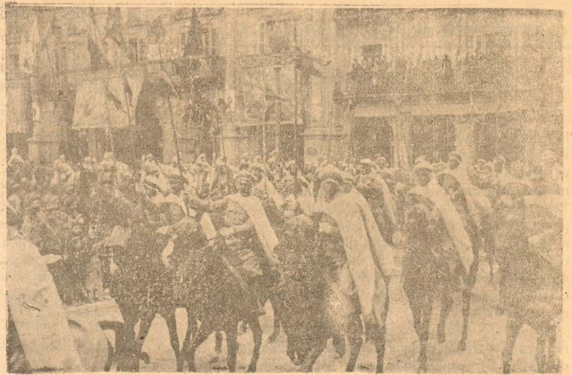
Guardia mora que dió escolta al Embajador de Italia en la presentación de credenciales