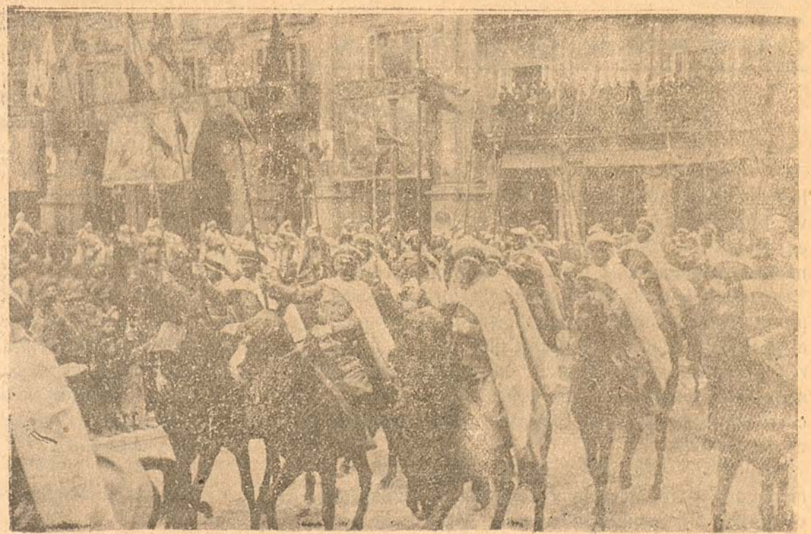
Guardia mora que dió escolta al Embajador de Italia en la presentación de credenciales