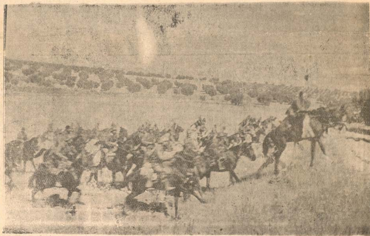
Un avance de nuestra Caballería

halagadoras; el Puente Pindoque es el primer paso de las operaciones; de la actuación de la punta de vanguardia dependerá toda una fase que dará fin al cerco de Madrid; y, cosas del frente, las caras se contraen y las bromas aumentan, saliendo a relucir las frases de rigor, argot del frente, herencia africanista, y así se oye hablar: un paso de bigote, de mucho tomate; el paso del señorito, y con estos y otros adjetivos titulan a ese verdadero paso de la Muerte, fatalmente necesario para nuestra futura actuación definitiva sobre Madrid.