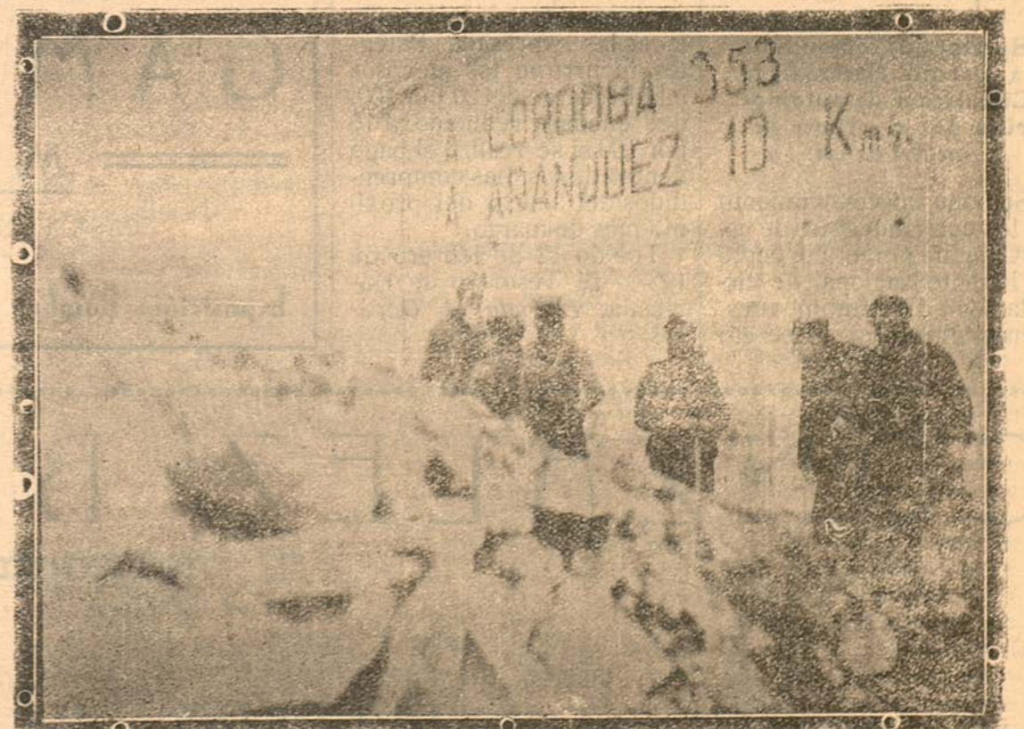
Un descanso al pie de la Caseta de Camineros en la Cuesta de la Reina

Gibraltar.—En las primeras horas de la mañana de hoy la escuadra nacionalista se presentó frente a las costas de Valencia. Inmediatamente comenzó el cañoneo del puerto y objetivos militares de la ciudad del Turia. El desconcierto y la alarma fueron imponentes, pues las gentes estaban muy lejos de suponer tal visita. Sonaron insistentemente las sirenas y las gentes buscaron refugio. Después de haber lanzado veinte disparos sobre la ciudad, nuestros barcos continuaron su vigilancia por la costa.—Radio A-Z