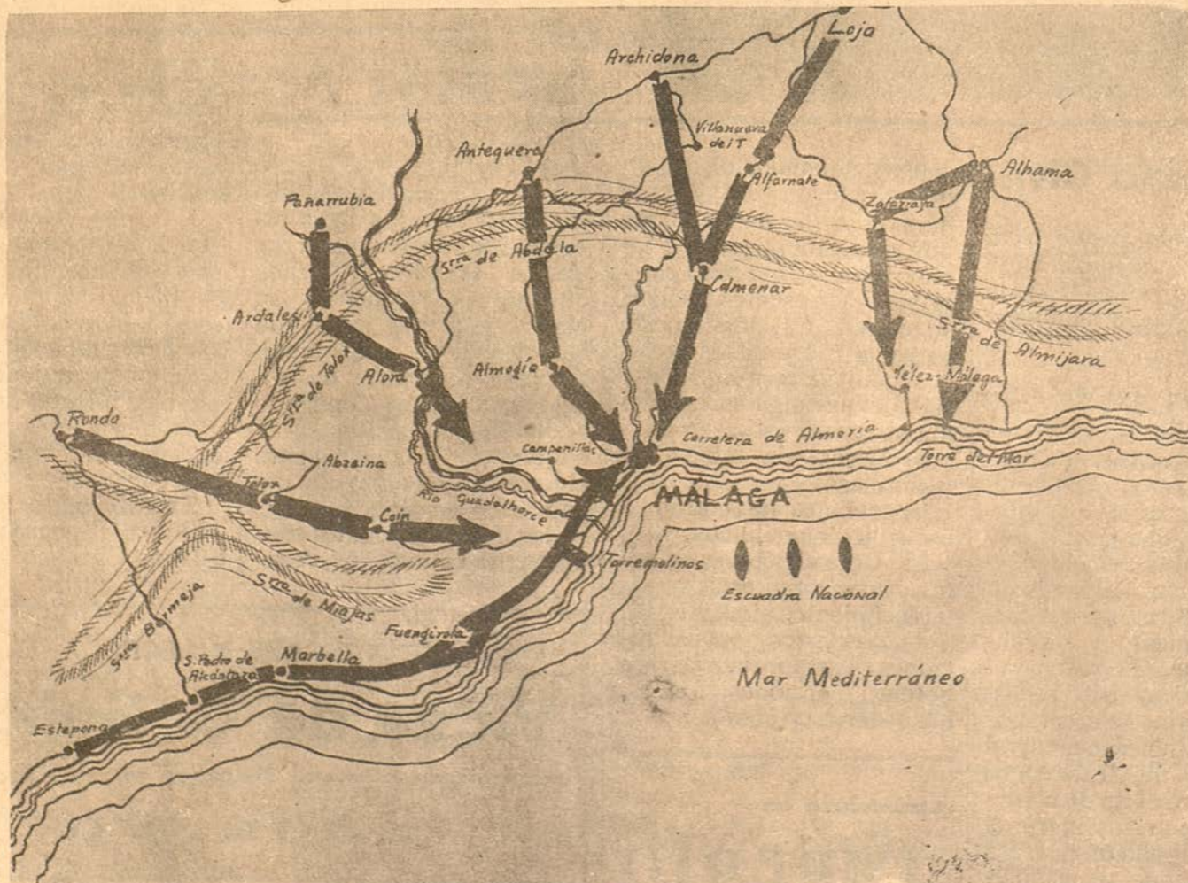
Las flechas indican los caminos recorridos por las columnas que tomaron parte en la toma de Málaga

pistando al mismo tiempo; otras tres columnas salieron, respectivamente, de Peñarrubia, Antequera y Ronda.