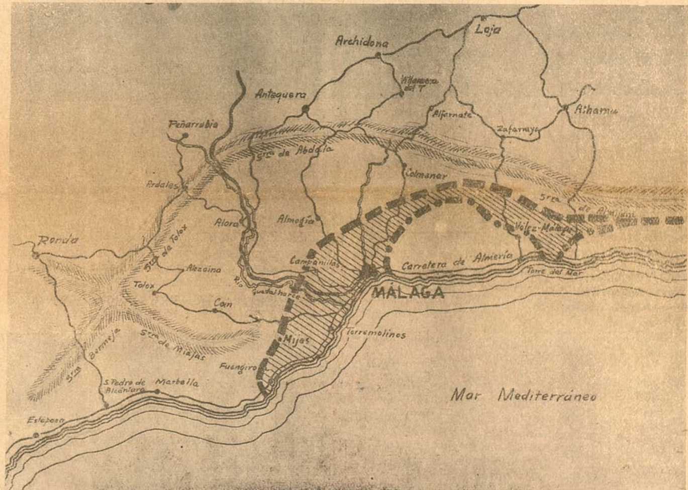
En el mapa queda señalado el avance de nuestras fuerzas verificado ayer

Siete columnas han tomado parte en la conquista de Málaga, sabiamente dirigidas por el siempre victorioso General Queipo de Llano. Dos de ellas partiendo de Alhama, atravesaron la Sierra de Almijara, en dirección casi vertical a la costa, su misión era la de cortar la retirada al enemigo, des-