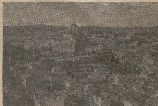
Museo de Tavera