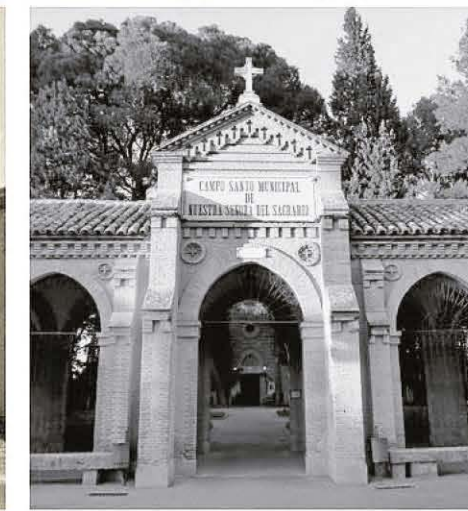
Algunos proyectos municipales afrontados en 1890. El aumento del abastecimiento de agua del Tajo; el alumbrado eléctrico desde la central de Saelices y las obras de dos renovados servicios: el Matadero y el Cementerio