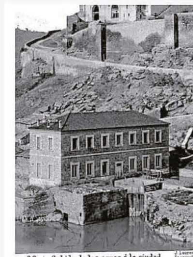
26. Subida de las aguas a la ciudad.