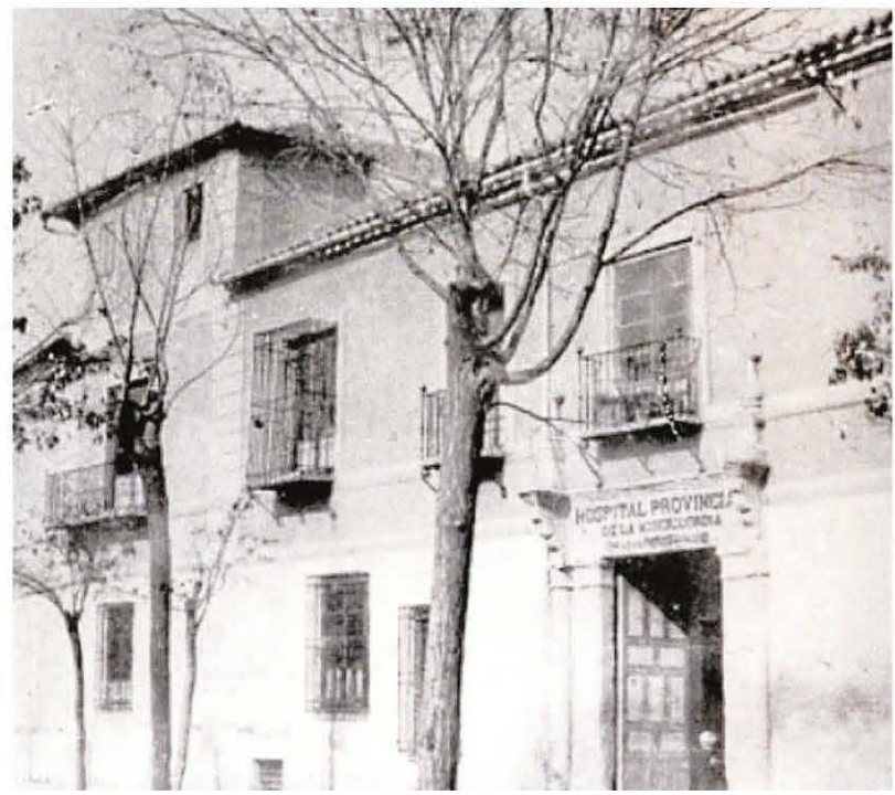
El Hospital Provincial en su antigua ubicación, en la plaza de Padilla, donde permaneció hasta finales de 1932. Siempre fue el principal centro de referencia médico-quirúrgica, de carácter público, en Toledo