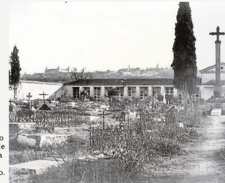
Aspecto del cementerio viejo de la Vega Baja, sin uso desde 1893, en una imagen fechada a principios del siglo XX.

tez para cremar los enseres del fallecido junto a su traslado y entierro en la misma jornada. Pero el fin de la pandemia estaba próximo.