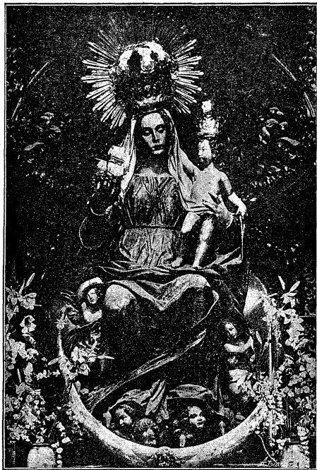
IMAGEN DE NUESTRA SEÑORA DEL BUEN AIRE

INTERNATIONALIS INSTITUTIO «ORA ET LABORA», anno 1905 in Seminario-Universitate Pontificia Hispalensi (Sevilla-España, Apartado postal 84) fundata, et Romanorum Pontificum benedictionibus abunde locupletata, seminariorum alumnos, crastinos sacerdotes, exercet in Paestra veri apostolatus, ut bonum Ceramen certantes, coronam justitiae habeant, simulque sacerdotes ipsos quamaxime juvat ad perfectionem et propriam et suorum apostolicorum operum, triplici in ordine, morali, nempe, technico et oeconomico inquirendam; necnon utitur in luctamine ideatum, sub Episcoporum moderamine, novissimis armis scientifico progressu acquisitis, et praecipue adjumento Prelii, quod per Cruciatam et annum celebrationem Dia de la Prensa Católica (29 Junii), oratione, propagatione et collecta , in toto orbe terrarum fovet, ad Evangelium Christi in mundum universum facilius et uberius, adjunctis temporum praecoculis habitis, praedicandum, quaerendo primum Regnum Dei, juxta illud S. Pauli Apostoli: Omnia vestra sunt; vos autem Christi; Christus autem Dei. — Dr. J. Montero.