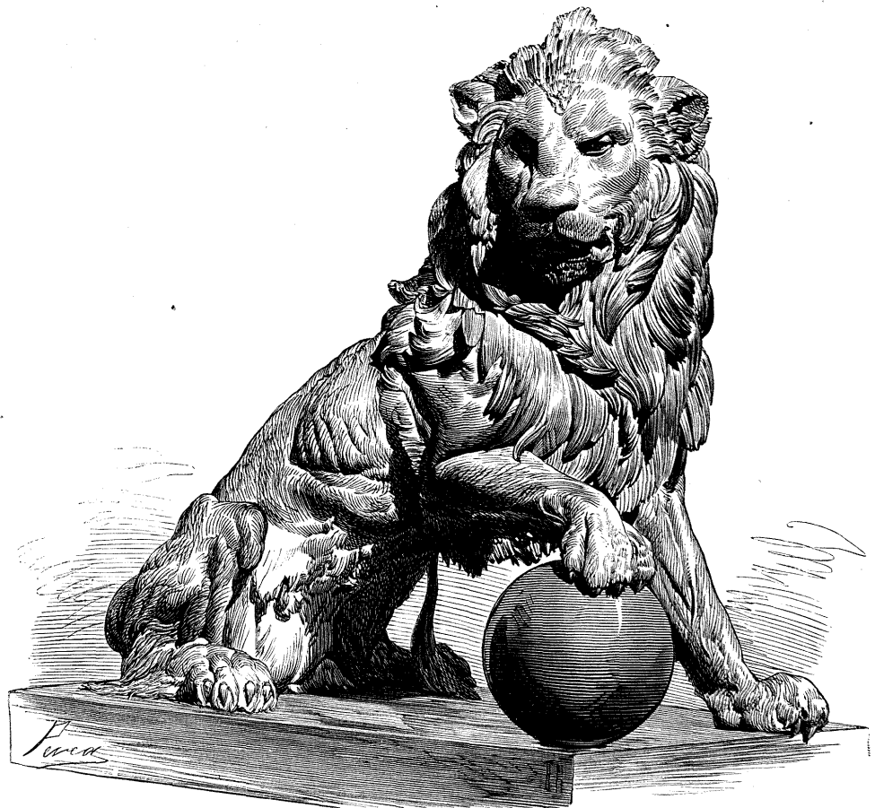
CONGRESO DE LOS DIPUTADOS.—LEON DE BRONCE, FUNDIDO EN SEVILLA.

Entre las personas distinguidas que han asistido á la última fiesta en concepto de curiosos, se cuentan varios príncipes; uno de ellos el príncipe Humberto. Tambien asistió Ricciotti Garibaldi.