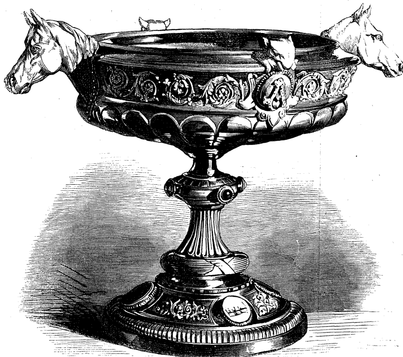
CARRERAS DE CABALLOS EN JEREZ.