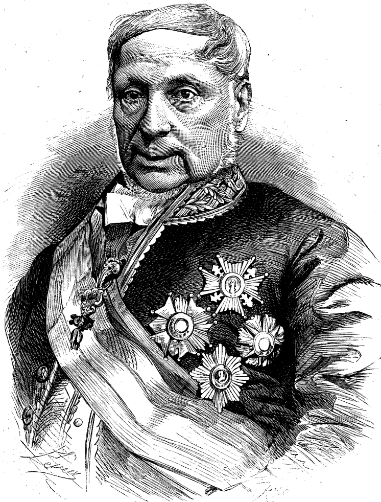
EXCMO SEÑOR MARQUÉS DE MIRAFLORES.

"Terreno moral adonde agarra todo linage de sembradura; él es en unas ocasiones flor que huele, en otras espiga que alimenta; en éstas arbusto que acompaña, en aquellas árbol que cobija; él es jardín y huerta, y prado y bosque; él con la poesía nos encanta, con la cien-