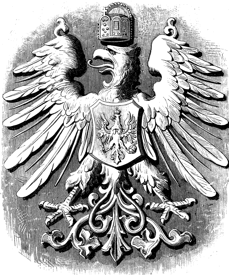
NUEVAS ARMAS DEL IMPERIO ALEMÁN.

Pero el fuego sagrado se extingue. Asiste á los conciertos del Buen-Retiro tanta concurrencia como asistía en otro tiempo á la de los Campos Eliseos; no va, sin embargo, animada de los mismos filarmónicos sentimientos. Los jardines del Buen-Retiro no son más que una prolongacion del Paseo del Prado. Se llega tarde al salón, segun rancia costumbre de la gente culta; se da una vuelta por Paris á contra pelo de los paseantes, segun uso no ménos antiguo, y luego... al concierto, á seguir la revista de las fisonomías de mejor tono y buen gusto de Madrid. El templete donde funcionan los músicos está en el centro; alrededor hay un pequeño vacío, punto de reunion de los sordos; despues muchas hileras de sillas; despues otro vacío, donde pasea el mundo elegante; despues... se rompe el círculo y siguen los jardines. La disposicion parece, en efecto, bien ideada para conciertos; sin embargo, es mucho mejor para