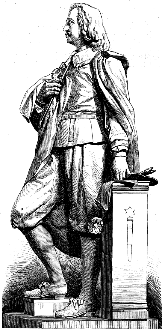
ESTÁTUA DE MURILLO, EJECUTADA POR EL SEÑOR MEDINA.

Estos hicieron bajar á los presos y les interrogaron. Flourens se desmayó. Los gendarmes ignoraban quién era el prisionero. Flourens volvió en sí. El capitán de gendarmería, exasperado por la jornada, le insultó. El preso se irguió ante las injurias, y en su indignacion exclama: