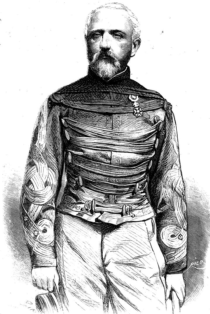
EL GENERAL CÁRLOS ABEL DOUAY, MUERTO EN LA BATALLA DE WISEMBURGO.

Hoy nos desviamos de esta línea de conducta para tratar