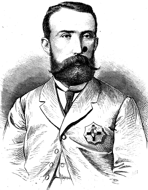
EL BRIGADIER CHINCHILLA.

Dos pilluelos pelean en medio de una plaza; el impulso natural de los transeúntes es formar corro y disfrutar con alegría de aquel honesto espectáculo; si algún filántropo se interpone entre los beligerantes, seguramente gana la mala voluntad de todo el público. Pues bien: Francia y Prusia se han echado el sombrero hácia atrás y se enseñan los puños. La consecuencia es lógica. Europa ha formado corro frotándose las manos.