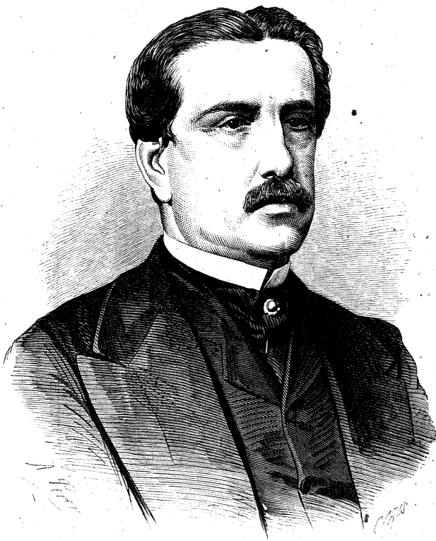
DON JUAN VALERA Y ALCALÁ GALIANO.

¡Pero qué espectáculo tan diverso! Vuestros ojos quedarán deslumbrados ante aquella corriente de seda y terciopelo, de hermosura y de riqueza que se establece desde la Fuente de Cibeles á la de la Castellana; vuestra vista se desvanecerá con aquel incesante ir y venir de infinitos trenes que conducen, como en carros de triunfo, á hermosas mujeres y orgullosos personajes, y que pasan como arrebatados por un torbellino, dejándoos en el alma un inexplicable sentimiento de admiración y envidia. Dad luego una vuelta por la Ronda, y sentireis el contraste en toda su fuerza. Entre el ruido y el polvo sin encantos que levanta algun ómnibus desvencijado, vereis grupos de viejas andrajosas y de súcios granujas, recostados en las tapias con indolencia, á modo