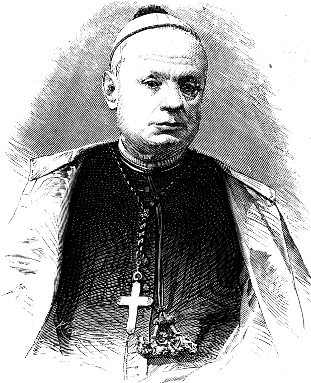
DON ANTOLIN MONESCILLO, OBISPO DE JAEN.

Se trataba de un sastre asesinado en un figon: el tabernero, no sabiendo cómo deshacerse del cadáver, discurrió el medio diabólico de que sus parroquianos le sacasen á raciones fuera de la tienda.