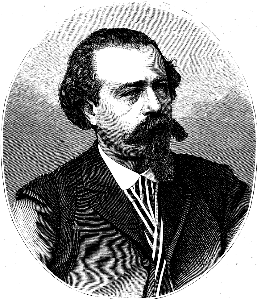
DON ADELARDO LOPEZ DE AYALA.

Pero un día llega también en que el hombre, tan descuidado y alegre, deteniéndose al hollar las más tempranas