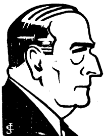
El ilustre ex ministro don Antonio Goicoechea, que el domingo tomó parte en el brillante acto celebrado en el Rojas.