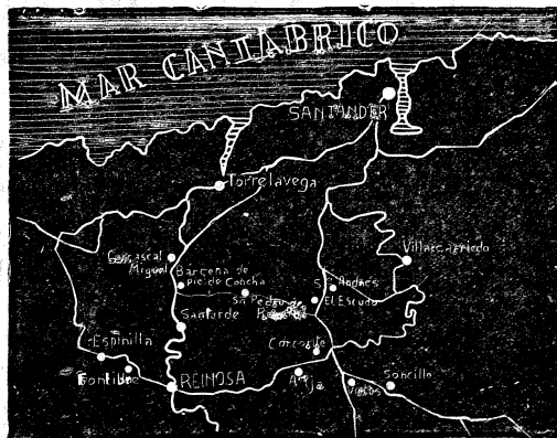
Ayer continuó el avance por los frentes de Santander

Sobre todas las cosas España, sobre España sólo Dios.